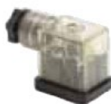
DIN 43650 - Industrial Standard B 11mm LED 24V/230V