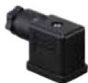
DIN 43650 - Industrial Standard B 11mm