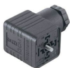
DIN43650 Form A 18 mm