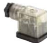
DIN 43650 - Industrial Standard B 11mm LED 24V/230V